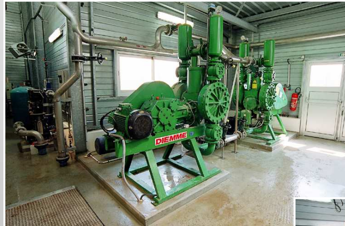
DESHYDRATATION DES BOUES POMPES