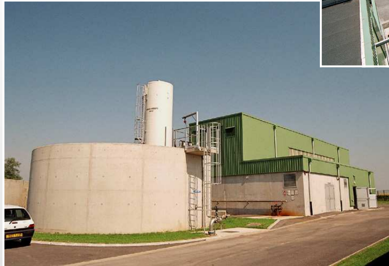
SILO A BOUES ET LOCAL DE DESHYDRATATION