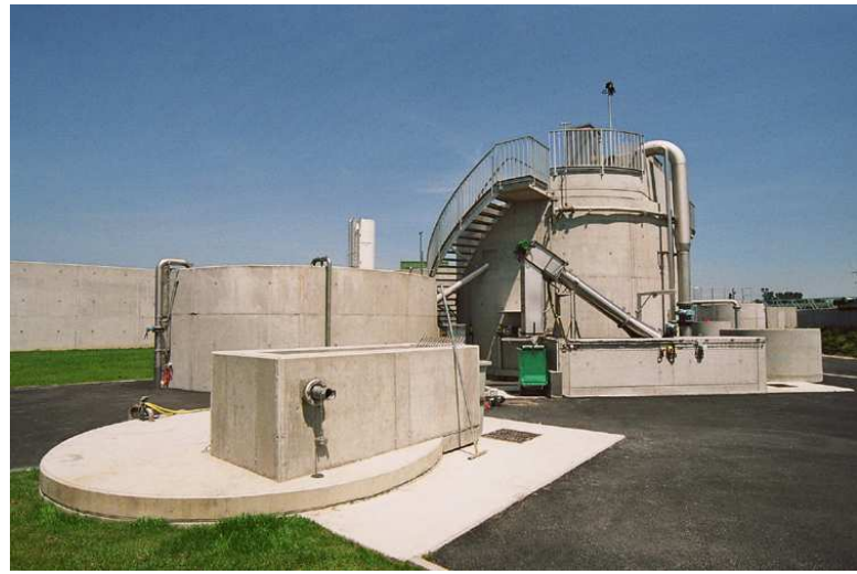
TRAITEMENT DES GRAISSES - PRETRAITEMENTS