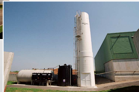
SILO A CHAUX (BOUES)