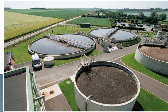
SILO A BOUES