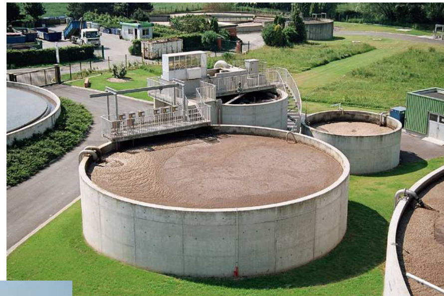
BASSIN DE DEPHOSPHATATION BIOLOGIQUE