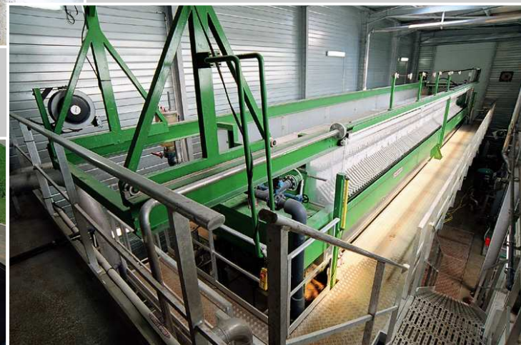
DESHYDRATATION DES BOUES FILTRE - PRESSE