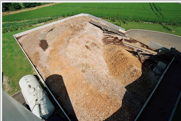
AIRE DE STOCKAGE DES BOUES DESHYDRATEES ET CHAULEES